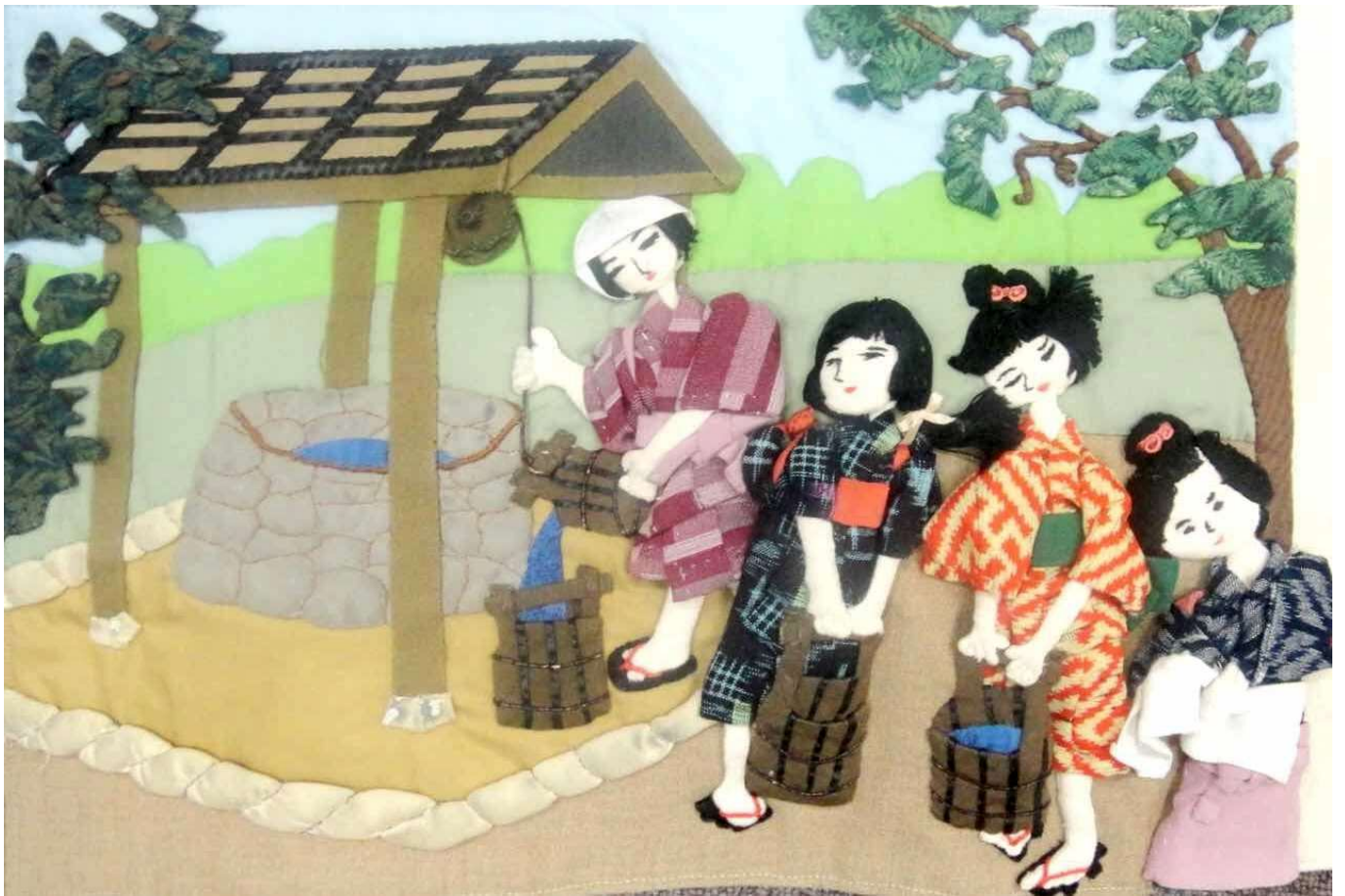
香芝市民図書館ボランティアサークル「ラ・ボ」さんによる香芝の民話絵・さわる絵本 みんわ