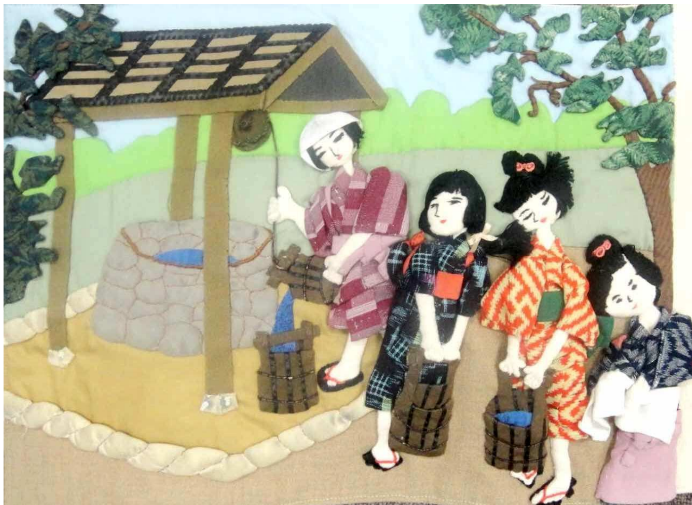
香芝市民図書館ボランティアサークル「ラ・ポ」さんによる香芝の民話絵・さわる絵本 みんわえ えほん